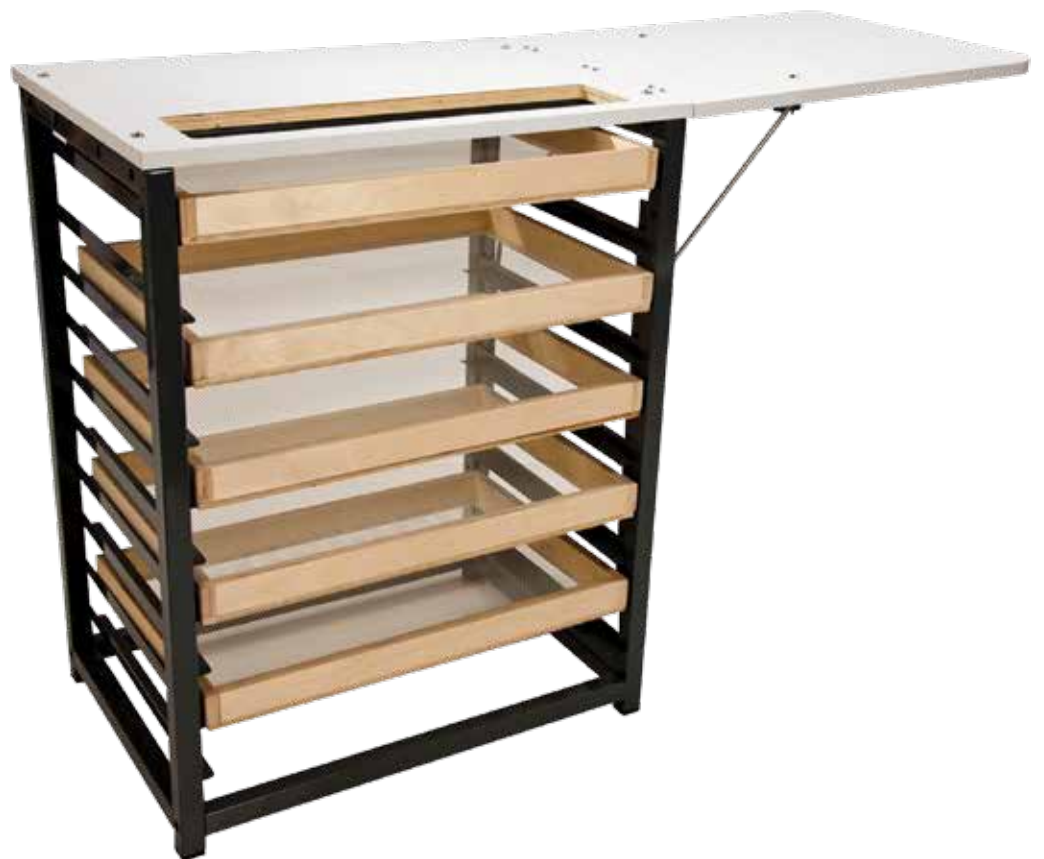
TABLEAU AVEC TERROIRS | ITEM GBM - R - TAV - 500

Tableau avec 5 terroirs et possibilité de soutenir l'extruseur.